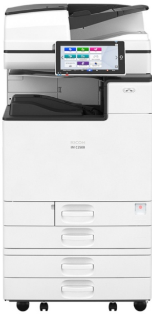
IM C2000 IM C2500

O Painel de Operação Inteligente de 10,1 polegadas possui uma interface touchscreen intuitiva e fácil de usar, os documentos digitalizados podem ser encaminhados para email, salvos em um local de rede ou enviados para um compartilhamento de documentos baseado em nuvem. As opções de finalização incluem um finalizador sem grampos que simula os dedos, que nitidamente dobra os conjuntos de documentos.