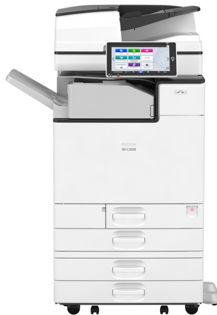
IM C3000 IM C3500

Scanner Digitalização: Full color Velocidade: 54 páginas (A4 ABL 200/300DPI) (pb/cor) Escala: preto&branco: 2 tones / Color/Gray scale: 256 tones Formato de compressão para Binary B&W Image:: TIFF (MH/MR/MMR/JBIG2) Formato de compressão para Gray Scale / Full Color: JPEG Resolução: 100dpi, 200dpi, 300dpi, 400dpi, 600dpi Formato de saída para email / folder: TIFF, JPEG, PDF, Clear Light PDF, PDF/A